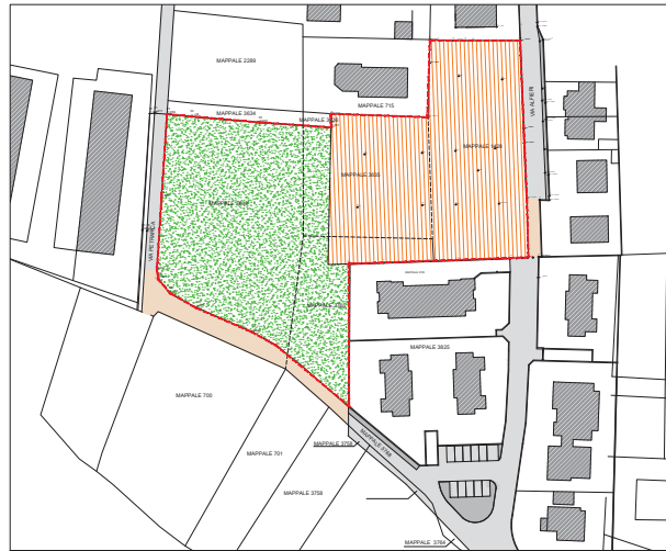
AMBITO ASB - PGT - DESTINAZIONE URBANISTICA