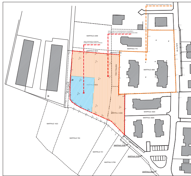
AMBITO ASB IN VARIANTE - DESTINAZIONE URBANISTICA